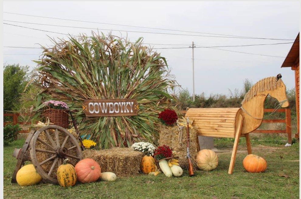
Проект COWBOYKY у Новому місті (Самбірський район)