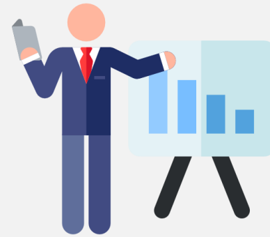
Детальний pitch 10-15 хв