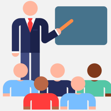
Короткий pitch 3-5 хв