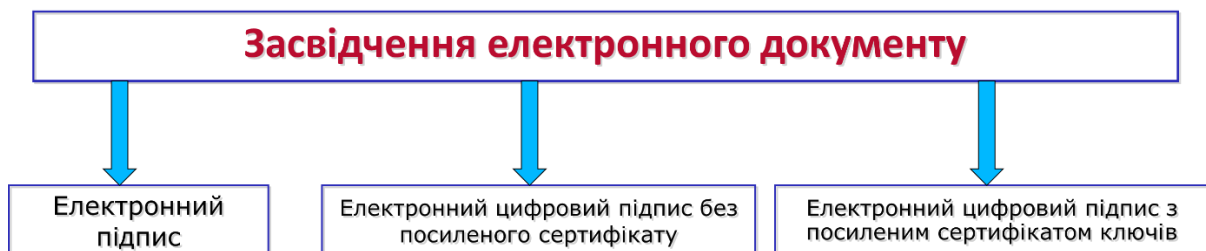
Рис. 1. Засвідчення електронного документу

3. Електронний цифровий підпис з посиленням сертифікатом ключів (ЕЦП з посиленням сертифікатом): Цей тип підпису використовує посилені сертифікати, які підтверджують ідентифікацію особи, яка використовує цифровий підпис. Він надає більшу юридичну обов'язковість та надійність підпису, оскільки особа засвідчена відповідними аутентифікаційними процедурами (рис. 1).